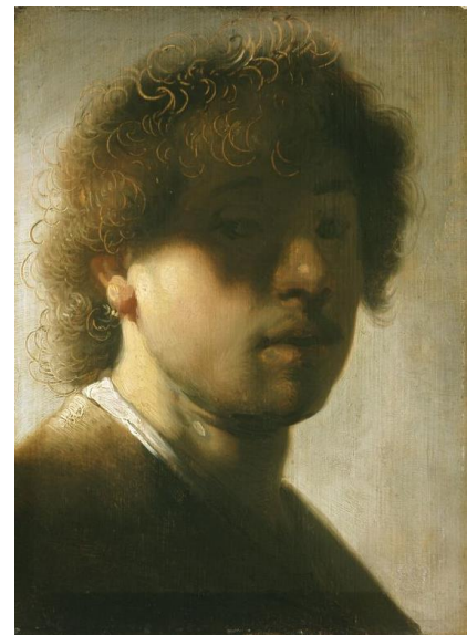
Rembrandt Harmensz. van Rijn, Selbstbildnis mit verschatteten Augen, nach 1631 © Hessen Kassel Heritage, Gemäldegalerie Alte Meister. Foto: Udo Reuschling