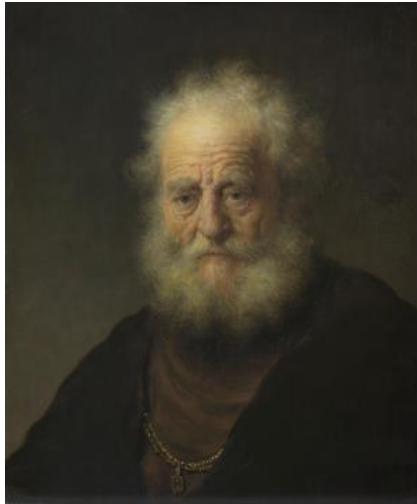
Rembrandt Harmensz. van Rijn (1606–1669), Büste eines Greises mit goldener Kette, 1632, Öl auf Eichenholz