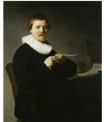
Rembrandt Harmenz. van Rijn (1606–1669), Bildnis eines federschneidenden Mannes, 1632, Öl auf Leinwand

Nun dürfen sich alle Kunstliebhaber mit der hochkarätigen Sonderausstellung „Rembrandt 1632“ erneut auf ein großes Highlight in Kassel freuen.