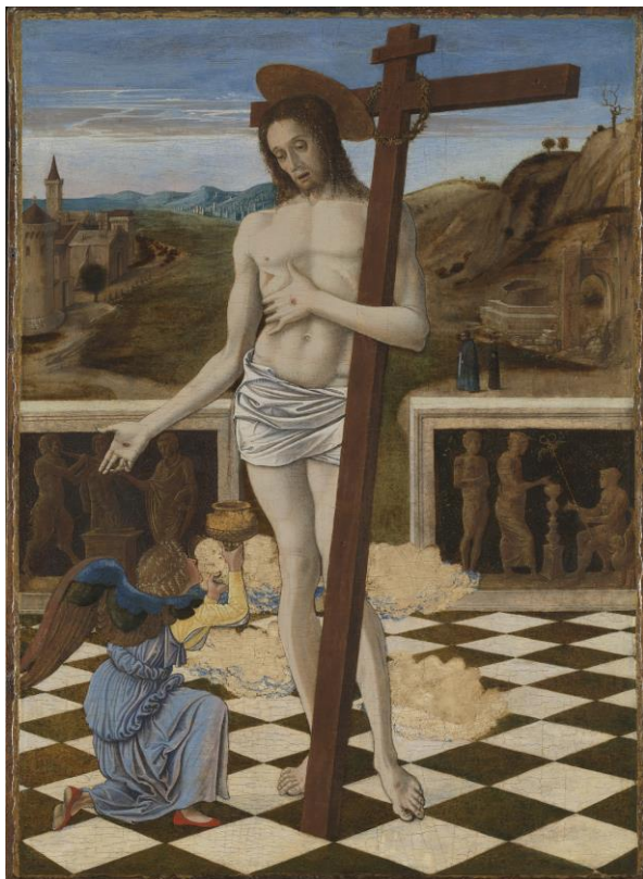
Giovanni Bellini, Das Blut des Erlösers, um 1460-65, Pappelholz, 47 x 34,3 cm

In den Sammlungen der Gemäldegalerie und der National Gallery sind Werke von Mantegna und Bellini in außergewöhnlich großer Zahl und Qualität vorhanden. Die Bestände umfassen Meisterwerke der beiden Künstler aus allen Schaffensphasen. Zudem beherbergen das Kupferstichkabinett der Staat-