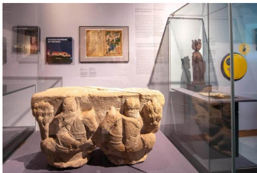
Blick in die Ausstellung

Diese Themen, wie auch die „Neuentdeckung“ der Burgen im 19. Jahrhundert, lassen sich sehr gut am Beispiel der Wartburg abbilden: Nach der sagenhaften Gründung der Burg im Jahr 1067 unter Graf Ludwig dem Springer wurde sie bis 1247 von den Ludowingern zu einer repräsentativen und vielseitig genutzten Residenz ausgebaut. Als reisende Herrscher