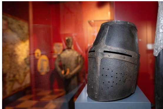
Blick in die Ausstellung

Die Eisenacher Sonderausstellung wartet unter anderem mit hochkarätigen Objekten wie bedeutenden Urkunden der Ludowinger und Kaiser Friedrichs II., höfischen und religiösen Schätzen oder einem mittelalterlichen Schachspiel auf. Das Modell einer Blide repräsentiert die gefürchtete Angriffswaffe des hohen Mittelalters und die originalgetreue Nachbildung eines Ringpanzers zeigt die Schutzausrüstung adliger Panzerreiter und vermögenden Fußvolks dieser Zeit. Die Ausstellungsgestaltung und -architektur mit großformatigen Darstellungen mittelalterlicher Buchmalereien