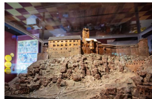
Blick in die Ausstellung

Zur Exposition ist ein reich bebildertes, 176-seitiger Begleitband mit Essays renommierter Fachleute, abwechslungsreichen Kurztexten und Katalogbeiträgen erschienen, die die in der Ausstellung präsentierten Exponate vorstellen. Die Publikation ist für 15 € käuflich zu erwerben.