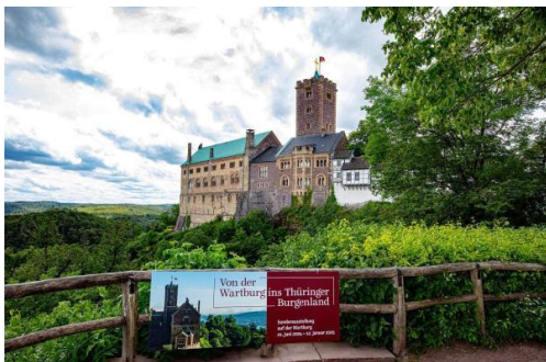
Blick auf die Wartburg mit Ausstellungsankündigung