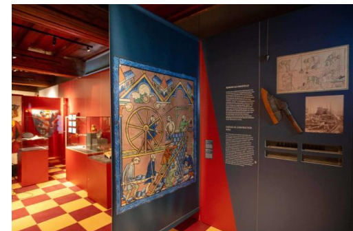
Blick in die Ausstellung