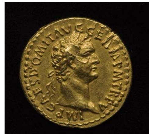
Sesterz des Kaisers Domitian, Vorderseite, 85 n. Chr.

dem Feldherrn Publius Quinctilius Varus keinesfalls ein unbedarftes „Greenhorn“ oder gar ein überforderter Verwaltungsbeamter die Truppen geführt hatte, sondern im Gegenteil ein sehr erfahrener und bewährter Mann, der u.a. in Afrika und Syrien als Statthalter erfolgreich tätig gewesen war. Mehrere Münzen ergänzen an dieser Stelle die Darstellung. Ausgestellt sind u.a. Münzen des Varus und des Kaisers Augustus. Sehr interessant ist auch ein Sesterz des Kaisers Domitian, der auf der Rückseite die Inschrift „Germania capta“ trägt und den Kaiser als Sieger über die im heutigen Hessen beheimateten Chatten feiert.