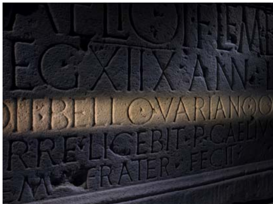
Abbildung oben und unten: Auf der Fotoabbildung der ersten Ausstellungswand hervorgehobener Bereich des Inschriftenteils des Caelius-Steins: Der einzige epigraphische Beleg der Schlacht im Teutoburger Wald, die hier als „bello Variano“, also als „Varuskrieg“ bezeichnet ist © LVR-Museumsverbund © Fotos: Axel Thünker DGPh

Auf der Rückseite der ersten Ausstellungswand sind auf der dortigen Foto-Abbildung des Caeliussteins zwei Worte hervorgehoben: „bello Variano“ („Varuskrieg“ oder auch „Krieg des Varus“). Wie bereits erwähnt ist dies die einzig erhaltene epigraphische Erwähnung der Schlacht im Teutoburger Wald, in der die Römer drei Legionen, die siebzehnte, die achtzehnte und die neunzehnte