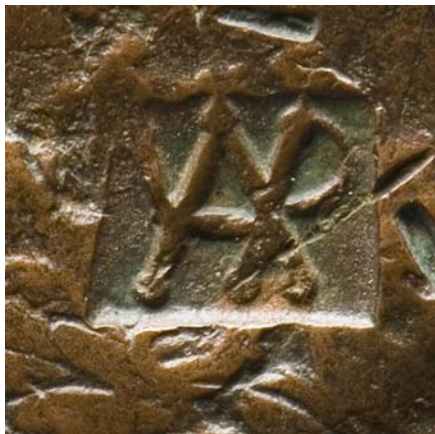
Sogenannter „Gegenstempel“ des Varus auf einer Münze

Abgesehen von der erwähnten historiographischen Ausnahmestellung birgt die Inschrift durch die hier geführte Bezeichnung der Schlacht als „bello Variano“ ein nicht minder interessantes Rätsel: Die Schlacht wurde nach Varus, dem Kommandeur der drei vernichteten römischen Legionen, also nach dem Verlierer des Kampfes benannt. Diese Namensgebung ist jedoch äußerst unüblich. Im Allgemeinen wurden die Schlachten der Römer nach ihren Gegnern benannt. In diesem Falle hätte die korrekte Bezeichnung also „bellum Germanicum“ oder „bellum Arminianum“, nach dem germanischen Heerführer Arminius, lauten müssen. Bei den Römern selbst liest man, etwa bei dem Schriftsteller Sueton (Augustvita 23) und dem Geschichtsschreiber Tacitus (Annalen 1,10), von der „clades Variana“, also der „Varuskatastrophe“. (s., Katalog, S. 26) Dass auf einem Ehrenmal für einen Gefallenen dieser Schlacht nicht gerade von der „clades Variano“ gesprochen wird, mag allerdings wohl einleuchtend erscheinen. Die Katastrophe oder vielmehr die Schande der völligen Niederlage muss für die Römer aber umso größer gewesen sein, da in der Schlacht mit