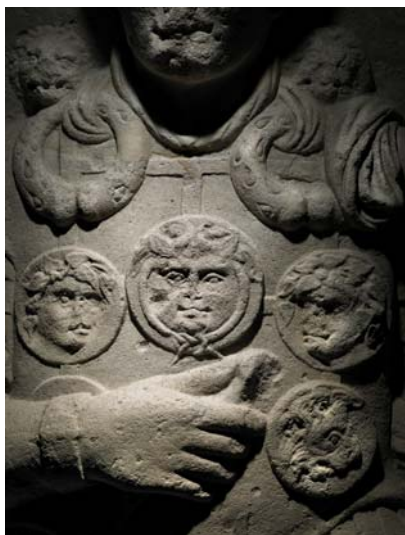
Ausschnitt aus der Fotoabbildung des Caelius-Steins mit den Auszeichnungen des Marcus Caelius: den „Phalerae“ (runde Plaketten) auf der Brust und den „torques“ (Nachbildungen keltischer Halsringe) auf den Schultern