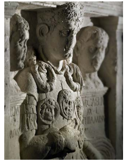
Bildausschnitt vom Caelius-Stein: Links und recht von dem in der Mitte dargestellten Marcus Caelius sind die auf kleinen Säulen ruhenden Köpfe zweier Freigelassener zu erkennen, deren Identität durch zwei kleine unterhalb der Säulen platzierte, zusätzliche Inschriften erklärt wird

Auch die folgenden Abschnitte bieten außergewöhnlich interessante und lehrreiche Einblicke in Leben, Kult und Kultur der Römer. Im sechsten Bereich „Menschenbilder“ etwa setzt sich die Exposition mit dem „Porträt“ auseinander und stellt dabei u.a. fest, dass die Bildnisse des Caelius-Steins sowie nahezu alle Por-