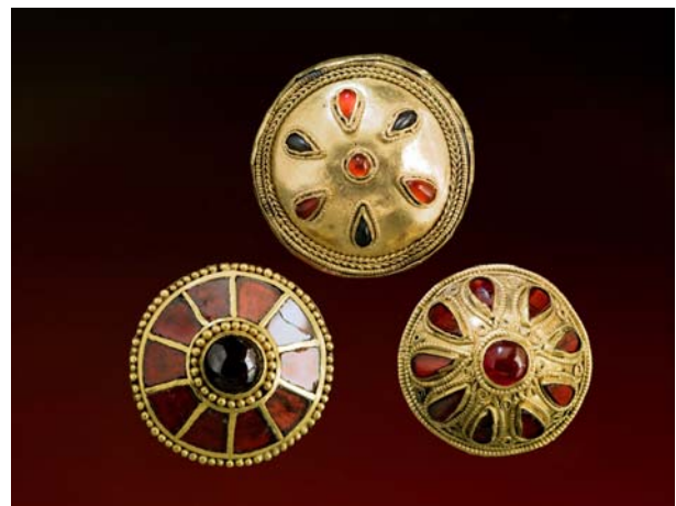
Goldene Schwertknäufe, um 500 n. Chr., aus dem nördlichen Schwarzmeergebiet (Taman), Durchmesser: je ca. 4 cm.