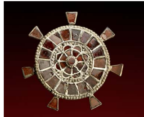
Fränkische Scheibenbroche für eine Frau, Gold und Edelsteine (Almandine), typisches Beispiel für die Goldschmiedekunst der Franken im Nordwesten Europas (nordfranzösisch/rheinischer Raum), spätes 6./frühes 5. Jahrhundert n. Chr., Durchmesser: 5,2 cm Solche Schmuckstücke zierten Mäntel und Kleider und zeigten dadurch offen das Familienvermögen der Besitzerin.

Zu Beginn der Exposition kann der Besucher in einer rechts vom Eingang stehenden Vitrine Reste des im Jahr 1943 in den Kellern des Wallraf-Richartz-Museum ver-