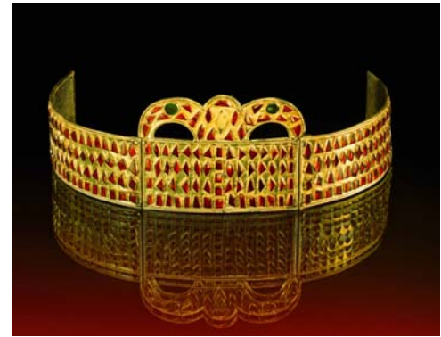
Die Kertscher Krone, kostbares Rangzeichen einer Fürstin, ca. 5. Jht. n. Chr., gefunden: 1904 in Kerč, Krim/Ukraine, in der Antike die große Handelsstadt Pantikapeion, Länge 34,2 cm. Die Krone war die ungewöhnlich aufwändige Grabgabe einer Fürstin aus dem Nomadenadel im Süden Russlands. Die Goldschmiedearbeit aus dem Schwarzmeergebiet weist auf spezialisierte Werkstätten der Völkerwanderungszeit im 5. Jahrhundert n. Chr.

Die neue Sonderausstellung des Römisch-Germanischen Museums bietet dem Besucher eine exquisite, sehr beeindruckende