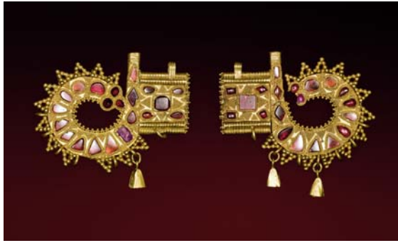
Fürstlicher Haubenschmuck, 1. Hälfte des 5. Jhts. n. Chr., Länge: 7,3 cm. Ungewöhnlich selten sind diese doppelseitig aus massivem Gold gearbeiteten Schmuckstücke der Völkerwanderungszeit. Solche kostbaren Goldschmiedearbeiten für Reiternomaden stammen aus Frauengräbern in den weiten Steppen Russlands. Die Seltenheit, die sonst weithin unbekanntem Entwürfe und die Tragweise geben noch immer Rätsel auf: Die Schmuckstücke wurden auf die Enden eines gespannten Bronzebandes aufgesteckt und über eine steife Filzhaube gezogen. Ebenso offen ist der Arbeitsort des Goldschmieds oder der Werkstätte: Wanderhandwerker oder Schmuckatelier in einer Stadt am Schwarzen Meer?

Die Glanzstücke der Exposition jedoch sind die „Kertscher Krone“, ein goldenes, mit Granatsteinen reich verziertes Diadem, das von stilisierten Greifenköpfen gekrönt ist, und der märchenhaft schöne fürstliche Haubenschmuck, der einem reiternomadischen Frauengrab der russischen Steppe entnommen wurde.