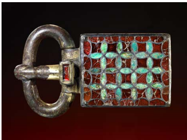
Große Schmuckschließe eines schweren Ledergürtels, aus dem Grab einer Frau in Monceau le Neuf, Dép. Aisne, Nordostfrankreich, 6. Jahrhundert n. Chr., Länge 10,4 cm. Die Bronzeplatte ist aufwändig mit einem symmetrischen Blütenmuster gegliedert. Grünes Emailglas und leuchtend rote Granatsteine sind kontrastreich gegeneinandergesetzt. Die Schnalle ist die Arbeit eines Kunsthandwerkers im westgotischen Stil und war wohl im Besitz einer vornehmen Westgotin (verheiratet mit einem fränkischen Adligen?).