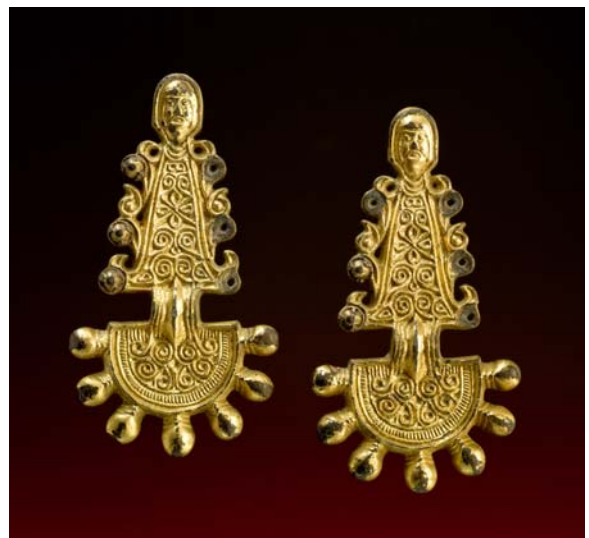
Ein Paar Schmuckbroschen aus vergoldeter Bronze, typisch weibliche Standszeichen im slawisch geprägten Donauraum, 7. Jahrhundert n. Chr., Länge: 13,3 cm. Frauen von Rang trugen solche Gewandspangen als Würdezeichen. Diese kerbschnittverzierten Broschen haben zugleich die praktische Aufgabe, die langen Kleiderbahnen zusammenzuhalten. Die Bügelspitzen zeigen stilisierte Menschenköpfe, vielleicht zur Übelabwehr.

ihrer Herkunft, sondern vor allem auch durch ihre künstlerische Meisterschaft. Diese trifft vor allem auch auf die als Höhepunkte der Exposition relativ zentral positionierten neun letzten Exponate bzw. Exponatgruppen zu. Auch unter den an dieser Stelle präsentierten Preziosen sind zahlreiche unterschiedliche Exponatstypen zu sehen, wie etwa ein Schwert mit Schwertscheide, das aus der Attilazeit stammende sogenannte „Diadem von Tiligul“ oder ein Paar Schmuckbroschen aus vergoldeter Bronze.