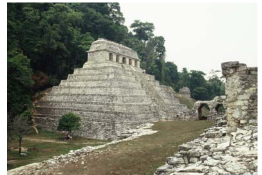
Tempel der Inschriften. Palenque, Mexiko © Dr. Inês de Castro

Der nun folgende erste Themenschwerpunkt stellt am Beispiel der Stadt Palenque die Architektur der Maya vor. Wie vor jedem neuen Abschnitt und Unterabschnitt vermittelt eine sehr informative Texttafel Grundwissen über den vorliegenden Themenkomplex. Schon der Titel des Abschnitts „Architektur – Nachbildung des Kosmos“ offenbart die zentrale Funktion der Architektur. Alle Bauten der Maya, vom einfachen Wohnhaus bis zur Pyramide, dienen der Nachbildung des Maya-Universums. Im Zentrum einer jeden Stadt standen die als Tempel fungierenden Pyramiden und die Paläste des Herrschers und Adels. Der Herrscherpalast diente dabei als Regierungssitz, Ort der Audienzen und Festlichkeiten sowie für die Gerichtshaltung. Der gesamte Tempel- und Palastbereich einer Stadt war zumeist nur dem Herrscher und Adel vorbehalten. Wichtige Bestandteile der Stadtgestaltung waren auch Ballspielplätze und steinerne Monumente, die der Götter-, aber auch der Herrscherverehrung dienten. Ziel der gesamten Maya-Architektur war es, die irdische mit der göttlichen Welt in Einklang zu bringen.