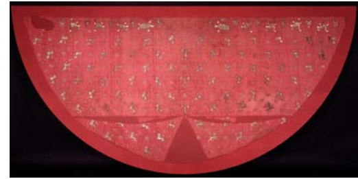
Mantel Kaiser Ottos IV.