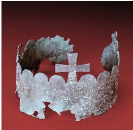
Grabkrone der Kaiserin Richenza, (kurz vor der Grablegung) 1141, Blei

deutung dieses Werks vor Augen zu führen, sei hier betont, dass die Welfen damit als erstes deutsches Adelsgeschlecht überhaupt ihre Geschichte festhalten ließen. Der Traum vom welfischen Kaisertum gründete sich auf zwei Aspekte. Zum einen war dies die traditionsreiche, bis zu den Karolingern zurückreichende Familiengeschichte: Kein anderes deutsches Adelsgeschlecht hatte so viele kaiserliche und königliche Vorfahren aufzuweisen. So konnte bereits der namengebende Vorfahr, der ab 819 als Graf belegte Welf I. († 876), seine ältere Tochter Judith (795-843) mit Kaiser Ludwig den Frommen (778-840) verheiraten und die jüngere Hemma (808-876) mit dessen aus einer früheren Ehe stammenden Sohn und späteren ostfränkischen König Ludwig den Deutschen (808-876). Zum anderen darf man die Königswahl von 1125 heranziehen, als nach dem Tod des Saliers Heinrich V. (1081/6-1125) überraschend der sächsische Herzog Lothar von Supplinburg (1075-1123) zum römisch-deutschen König gewählt wurde. Diese Wahl wurde nur dadurch möglich, dass der welfische Herzog Heinrich der Schwarze (1075-1126) plötzlich seine ursprüngliche Unterstützung für den Staufer Herzog Friedrich II. von Schwaben (1090-1147) zurückzog und für den Sachsen stimmte. Als Gegenleistung verheiratete Lothar von Supplinburg seine Tochter Gertrud (1115-1143) mit dem Sohn Heinrichs des Schwarzen, Heinrich den Stolzen (1102/8-1138), dem Vater Heinrichs des Löwen und Großvater Ottos.