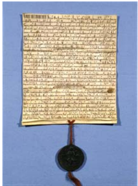
Testament Ks. Ottos IV.