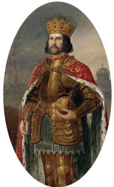
Christian Tunica, Porträt von Kaiser Otto IV., Braunschweig 1835