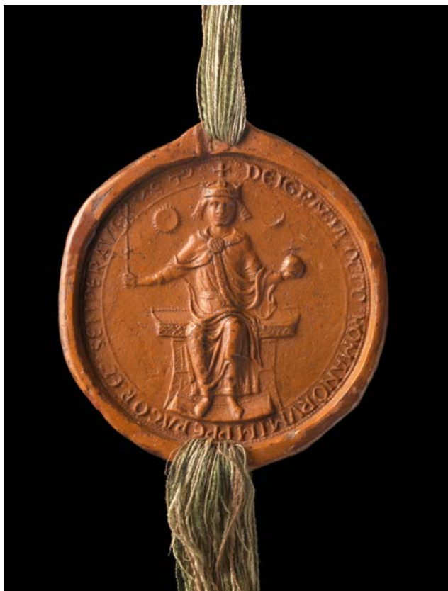
Kaisersiegel Kaiser Ottos IV.

Kaiser gekrönt. Er war damit am Höhepunkt seiner Macht angelangt und hatte den Traum vom welfischen Kaisertum erfüllt.